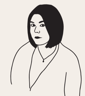
Chloé Delaume · Paris, FR Écrivaine. Writer.