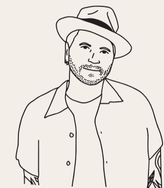
Matt Sorum · Palm Springs, USA Batteur, ancien membre du groupe Guns N' Roses. Drummer, former member of the Guns N' Roses.