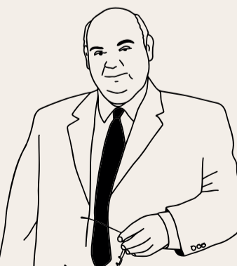
Michel Pastoureau · Paris, FR Historien, spécialiste de la symbolique des couleurs. Historian, specialist of the symbolism of colors.