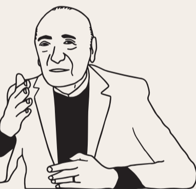
Jacques Séguéla · Puteaux, FR Publicitaire, Administrateur d'Havas Group. Publicist, Director of Havas Group.