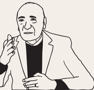
Jacques Séguéla · Puteaux, FR Publicitaire, Administrateur d'Havas Group. Publicist, Director of Havas Group.