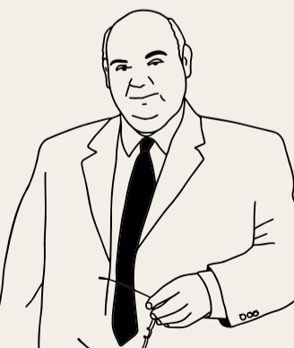
Michel Pastoureau · Paris, FR Historien, spécialiste de la symbolique des couleurs. Historian, specialist of the symbolism of colors.