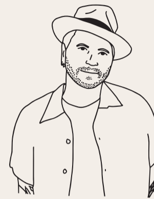
Matt Sorum · Palm Springs, USA Batteur, ancien membre du groupe Guns N' Roses. Drummer, former member of the Guns N' Roses.